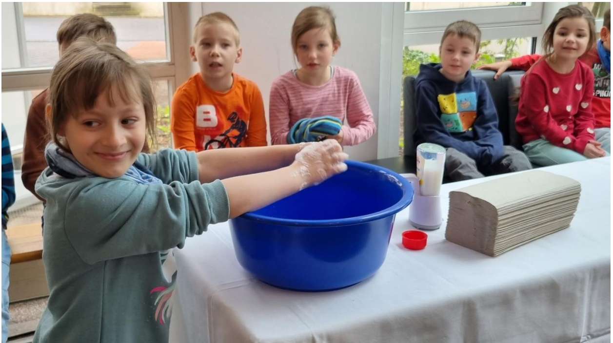
Kinder der Lorenz Kenner Schule - 1. Klasse – Händewaschprojekt

Insgesamt war der Aktionstag der Händehygiene in der Kurparkklinik ein inspirierendes Ereignis, das nicht nur dazu beitrug, das Bewusstsein für die Bedeutung der Händehygiene zu erhöhen, sondern auch die Zusammenarbeit zwischen verschiedenen Institutionen und die aktive Beteiligung der Gemeinschaft unterstrich. Es war ein Tag voller Engagement, Wissensaustausch und praktischer Erfahrungen, der einen nachhaltigen Eindruck bei allen Teilnehmern hinterließ und das Streben nach einer gesünderen Zukunft unterstützte.