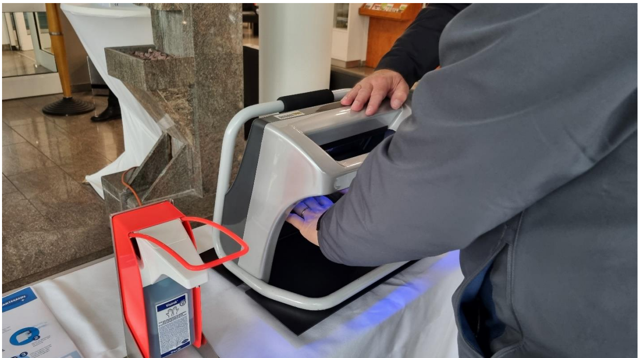
Kontrolle der Händehygiene mit Schwarzlicht – am Stand der Firma Hartmann