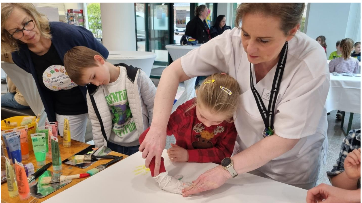
Kinder der Lorenz Kenner Schule - 1. Klasse – Händeabdruck mit Farbe