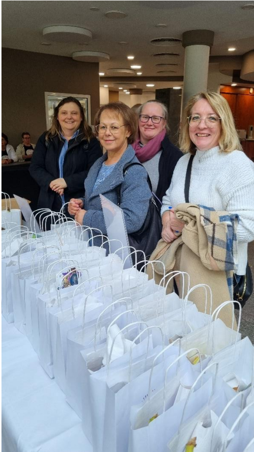
Für jeden eine Tüte mit Infos.