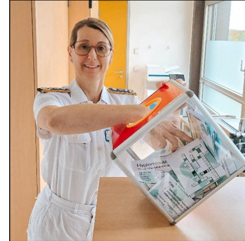
Die Hygienikerin als Glücksfee

Der Aktionstag 2025 hat allen Beteiligten wieder großen Spaß gemacht. Durch die vielfältigen Angebote konnte erneut eine Brücke zwischen hektischem Klinikalltag und gelebter Hygiene gebaut werden!