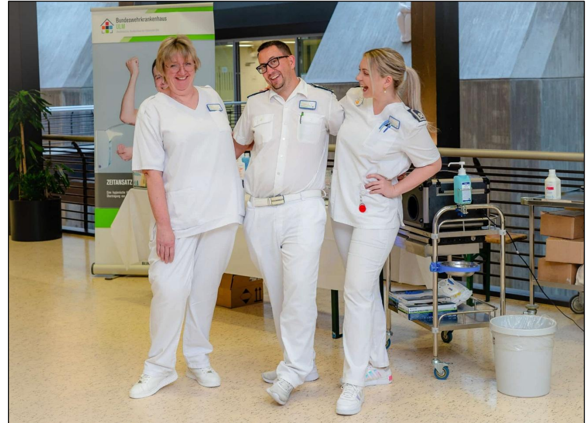
Die Hygienefachkräfte haben Spaß am Aktionstag

Im Fokus standen Studien und Informationsmaterial zum Umgang mit Abwasser, Dienstwäsche und die 5 Momente der Flächendesinfektion. Allesamt Themen, die im Klinikalltag gerne vernachlässigt oder weniger beachtet werden, aber dennoch sehr wichtig sind.