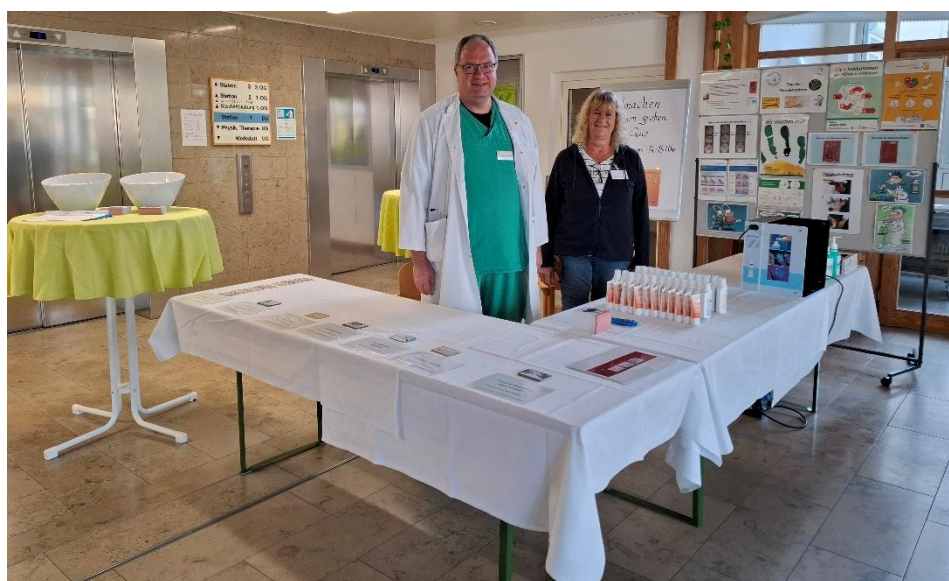
Bild: Krankenhaushygiene und Informationsstand