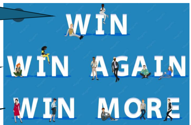
page 4

Vermeidung Abfall Reduziert Müllberge und de- ren Entsorgung