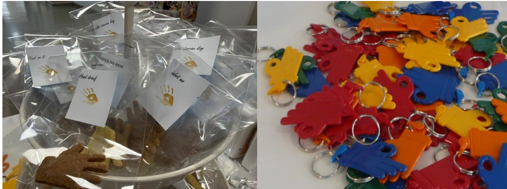
Abbildung 2: Hände in Form von Keksen und Schlüsselanhängern.

Zur Sensibilisierung auch in anderen Hygienethemen wurde an einem Standort ein „Glücksrad“ aufgestellt. Auf allen Feldern des „Glücksrades“ waren Fragen hinterlegt, welche durch die teilnehmenden Mitarbeiter:innen zu beantworten waren.